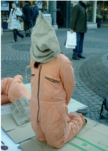
Protestaktion gegen den Krieg

„Der Westen hat gute Gründe, über eigene gemachte Fehler nachzudenken.“ Auch der Papst hat indirekt von einer Mitschuld der NATO am Krieg gesprochen. Das soll keineswegs den Krieg rechtfertigend relativieren. Aber aus dieser Einsicht könnten zukünftig solche Fehler vermieden werden und deren Eingeständnis könnte bei Verhandlungen Brücken bauen.