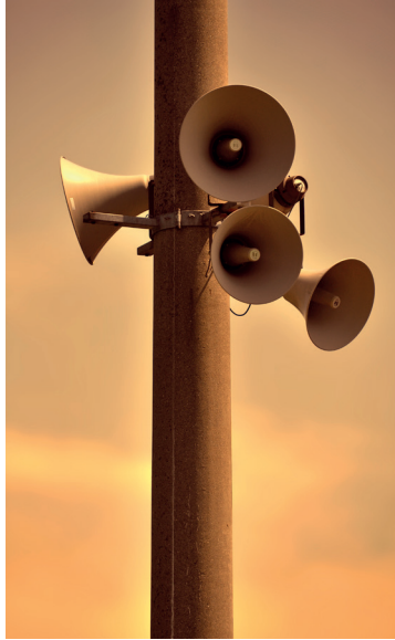
Laut und deutlich

wahrung der Schöpfung engagiert, trat für mehr Demokratie in der Kirche und für ein stärkeres soziales und politisches Engagement dieser Kirche ein und hat auf diese Weise eine Reihe von Reformprozessen in der Landeskirche angestoßen. Er hat sich aber – andererseits – fast schon am eigenen Erfolg der früheren Zeit überflüssig gemacht, wie es unlängst ein Mitglied unserer Richtungsgruppe ausdrückte, und dies in einer Kirche, die sich selbst immer weniger als eine politische Kirche