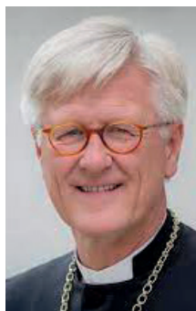
Heinrich Bedford-Strohm ab 2011