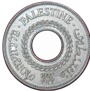
Dreisprachige Münze im Britischen Völkerbundsmandat für Palästina

Andererseits führte die geschichtsbewusst diplomatische Vorsicht dazu, dass die Lage der Palästinenser in der deutschen Öffentlichkeit sehr wenig differen-